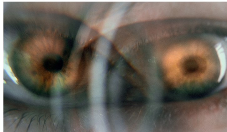
© Anita Marijana Bajic, Anna Miethe

Mit großer Freude präsentiert der Freundeskreis der Bildenden Künstler in Braunschweig e.V. in beiden Torhäusern an der Humboldtstraße den 30. Kunstmarkt. In der großen Gruppenausstellung können Werke von regionalen KünstlerInnen erworben werden, die künstlerische und mediale Bandbreite bietet für alle etwas. Während der Öffnungszeiten sind viele KünstlerInnen zugegen, so dass man auch direkt von den ProduzentInnen Details zu den Werken erfahren kann. Begleitet wird der Kunstmarkt am Wochenende von einem vorzüglichem Kaffee&Kuchen Angebot- ein Genuss für alle Sinne. Kunsthau BBK & Torhaus des botanischen Gartens / Humboldtstraße 34 + 1 www.kunstfreunde-braunschweig.de